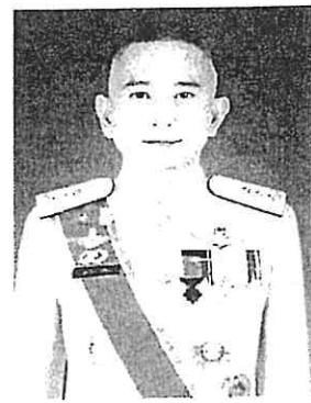
๘. พลโท วุฒิไชย อิศระ เจ้ากรมแพทย์ทหารบก